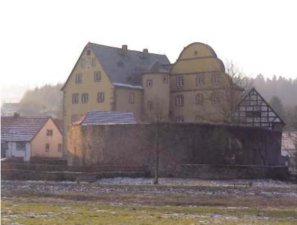
In Burgjoß thront die Mainzer Amtsbau über der Jossa.