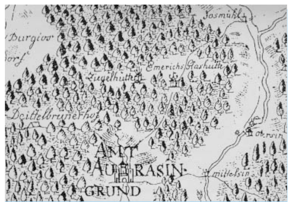
Die Fackenhofenkarte von 1791 zeigt den weiler Emmerichsthal auf einer Lichtung bei Obersinn.