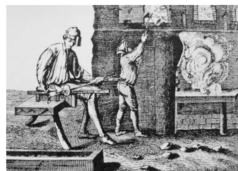
Die Abbildung aus der Enzyklopädie von Diderot und D'Alembert aus der Mitte des 18. Jahrhunderts zeigt die Fertigstellung eines Kelchglases durch einen Glasmacher. Ähnlich haben wir uns diesen Vorgang in der Emmerichsthaler Glashütte vorzustellen.