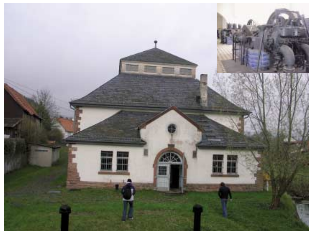
Das Wasserwerk von 1914 ist der technikgeschichtliche Höhepunkt in Mernes.