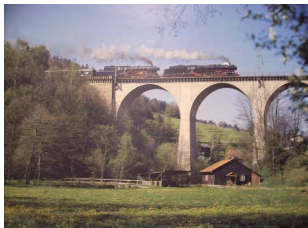
An der Mündung der Jossa in die Sinn quert ein Viadukt das Tal bei Jossa.