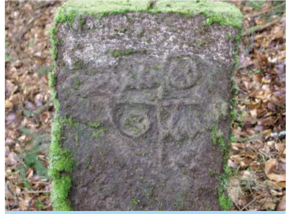
Bei Emmerichsthal finden sich noch Grenzsteine der Absteingung von 1573. Sie sind die ältesten im Spessart.

Der Weiler Emmerichsthal hat seinen Vorläufer im Mittelalter. Das Dorf Steinbach (man spricht heute noch von „de Schtämich“) wird in Urkunden des 14. Jahrhunderts genannt, spätestens seit 1313. Steinbach war eine bäuerliche Siedlung. Um 1573, zur Zeit der neuen Grenzziehung war die kleine Ansiedlung von ihren Bewohnern verlassen worden. Danach suchte die mainzische Verwaltung, aus dem Waldbesitz des Erzstifts an dieser Stelle Kapital zu schlagen. Schließlich kam man im 18. Jahrhundert an der kurfürstlichen Rentkammer auf die Idee, hier eine Glashütte zu errichten, weil Holz als Brennstoff im Überfluss vorhanden war. Die Glashütte begann 1768 den Betrieb mit 15 Mitarbeitern. Jedoch stellten sich die erwarteten Erfolge nicht ein, denn in den Folgejahren wechselten die Pächter mehrmals. Der letzte Pächter stellte die Glasproduktion 1826 ein. Danach arbeiteten die verbliebenen Bewohner im land- und forstwirtschaftlichen Bereich. Seit 1814 ist Emmerichsthal bayerisch, als Ortsteil von Obersinn. Aus den Gründungsjahren Emmerichsthal 1766/68 blieben bis heute das zweistöckige Wohnhaus (Herrenhaus) und das heute als Scheune und Stallung hergerichtete Glashüttengebäude erhalten.